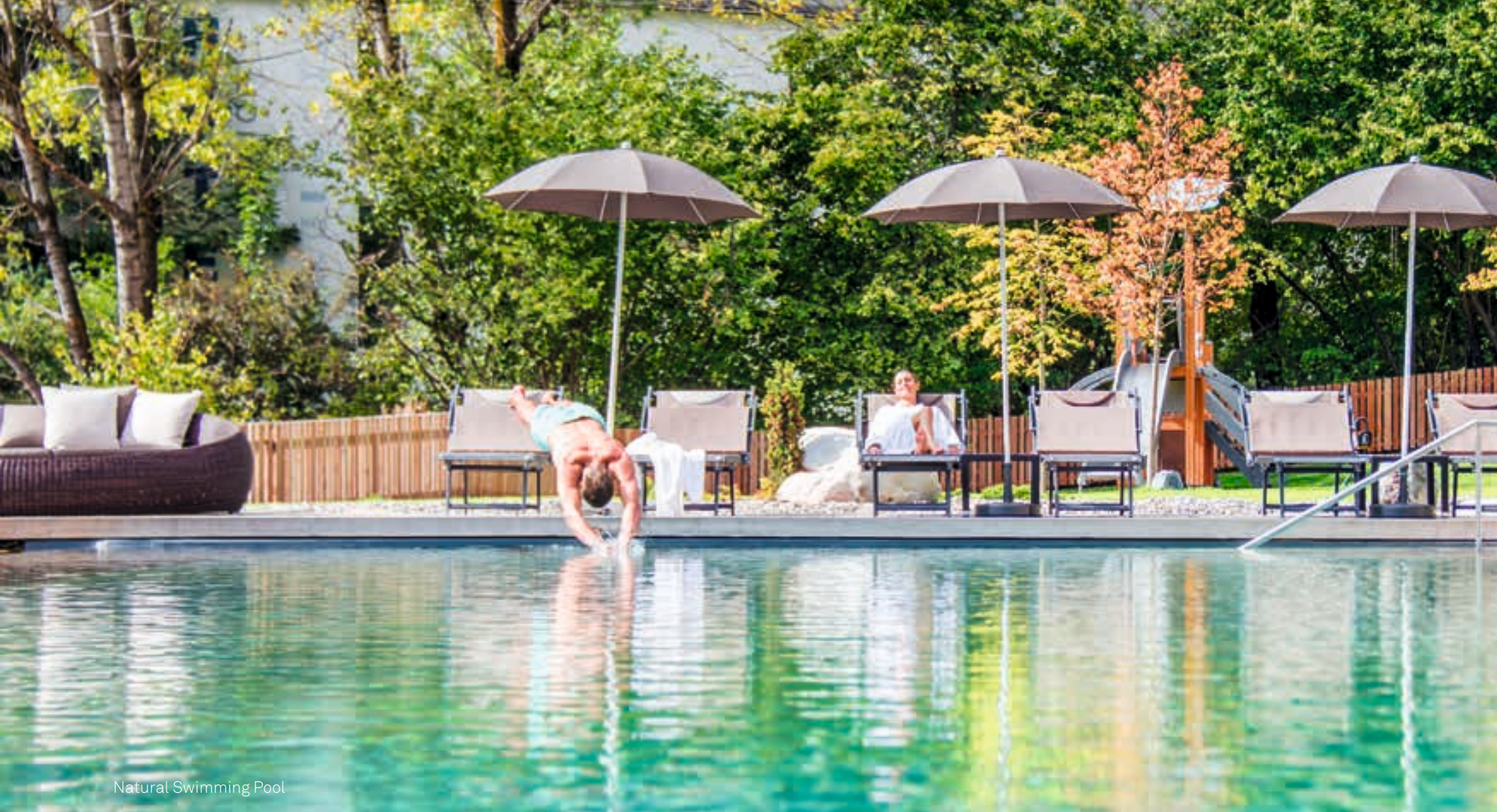
Natural Swimming Pool