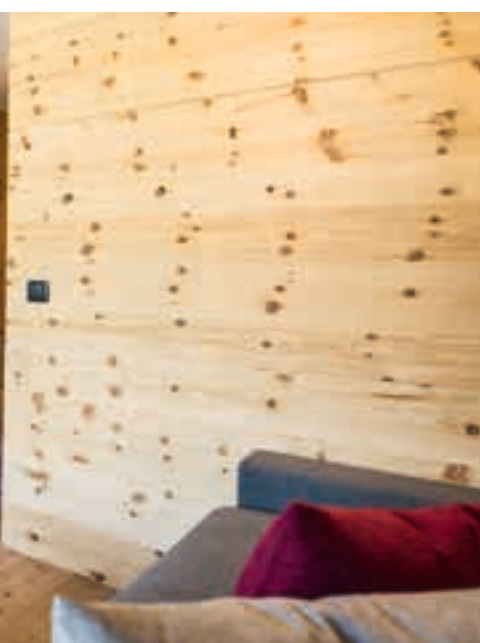
Relaxing Room Zirm