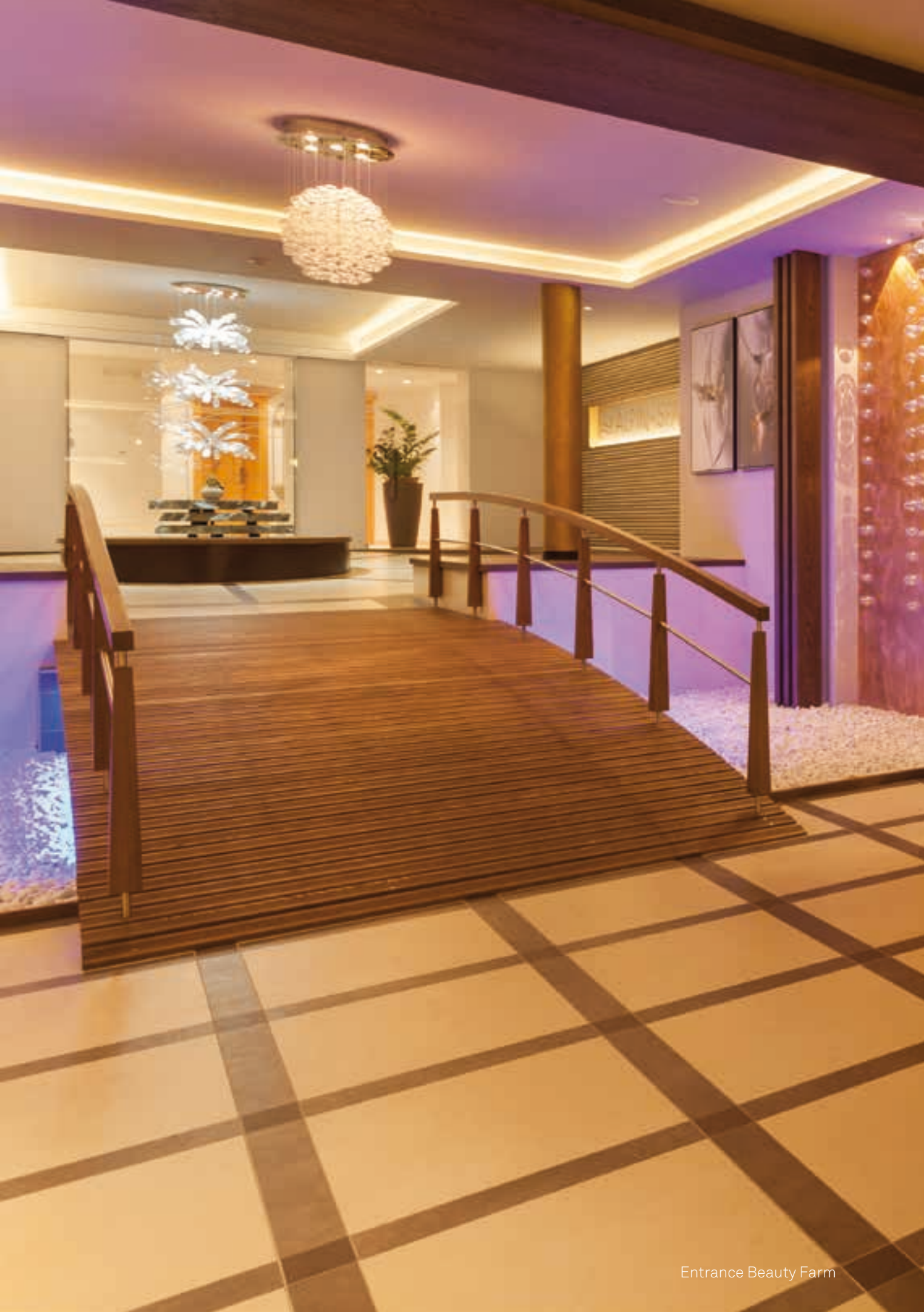
Entrance Beauty Farm