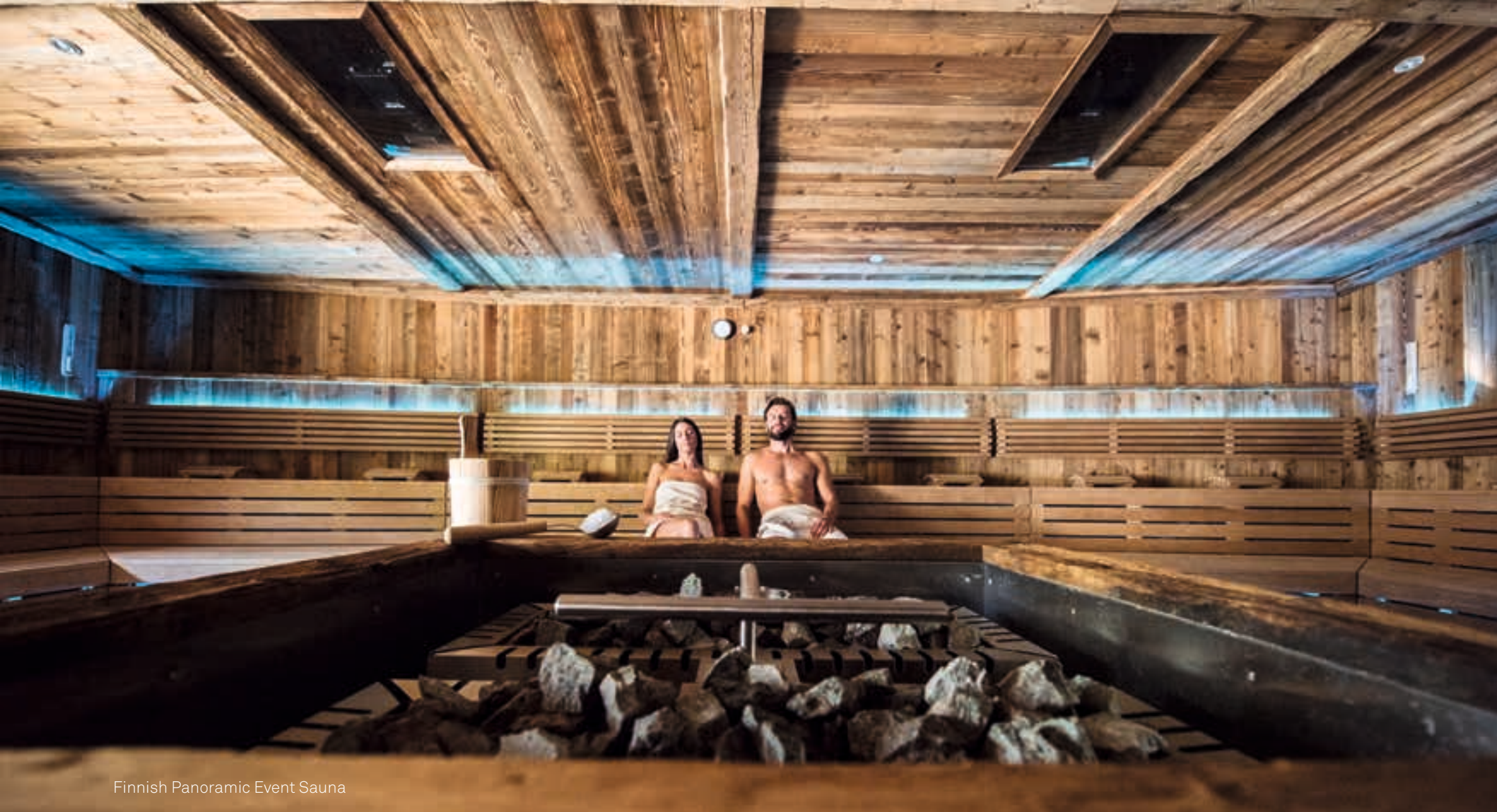
Finnish Panoramic Event Sauna