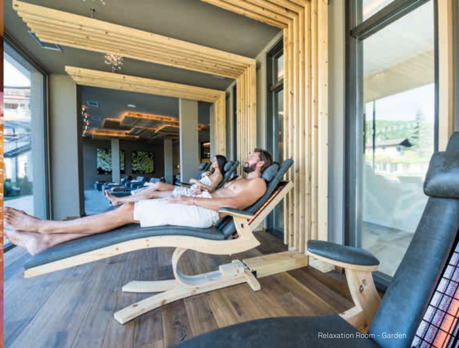
Relaxation Room - Garden

Augenblicke der totalen Entspannung erleben. Durchatmen, loslassen und einfach sein. In unserer Wellness-Oase der Ruhe können Sie neue Kräfte sammeln. Lassen Sie sich verwöhnen!