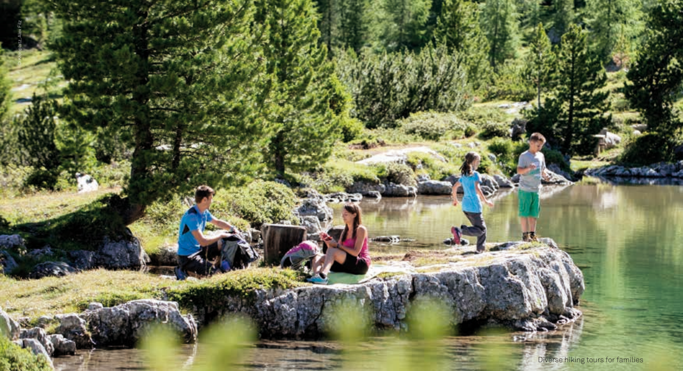
Diverse hiking tours for families