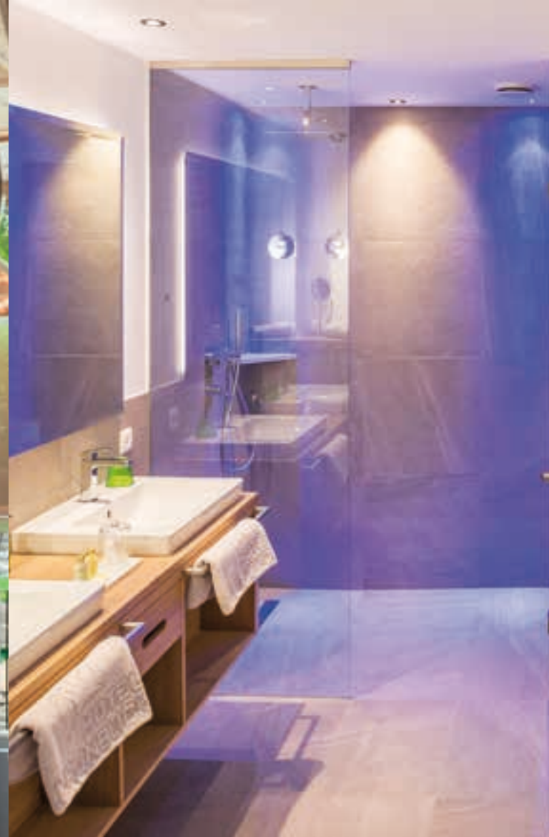
Bathroom Living Dream