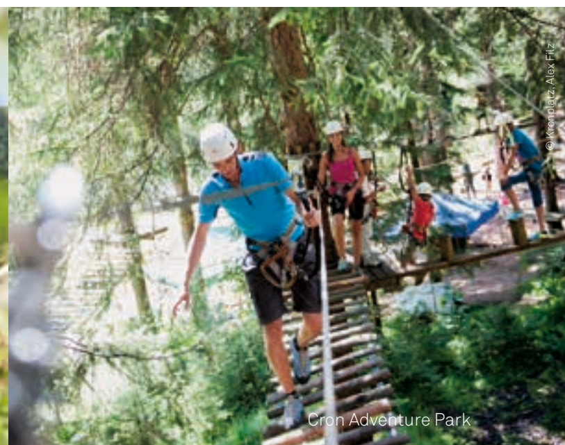
Cron Adventure Park