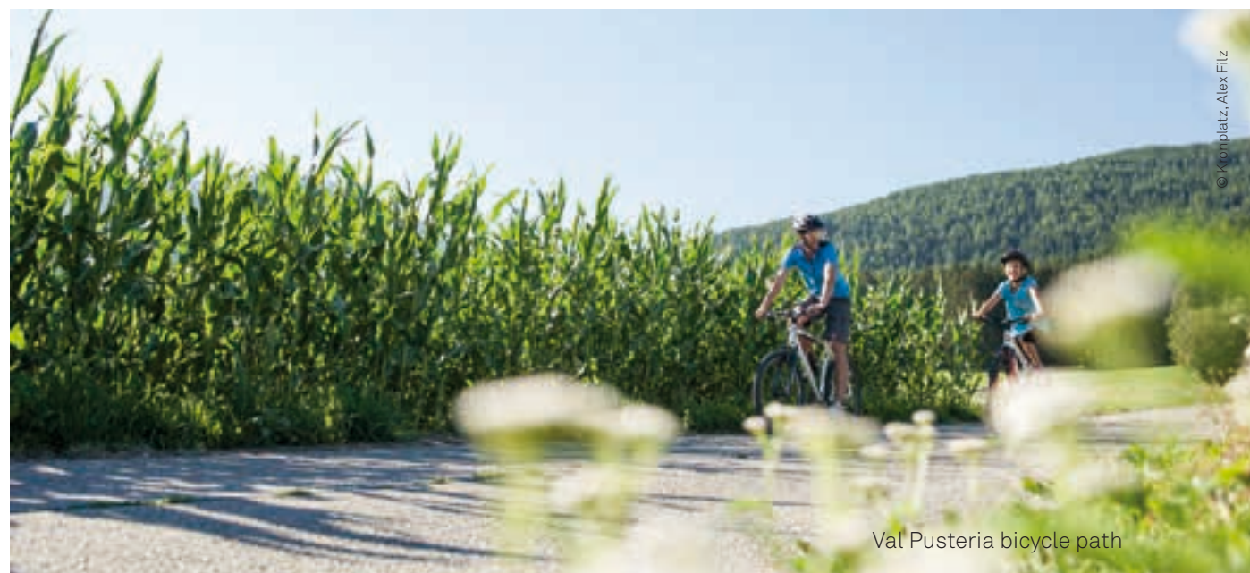
Val Pusteria bicycle path