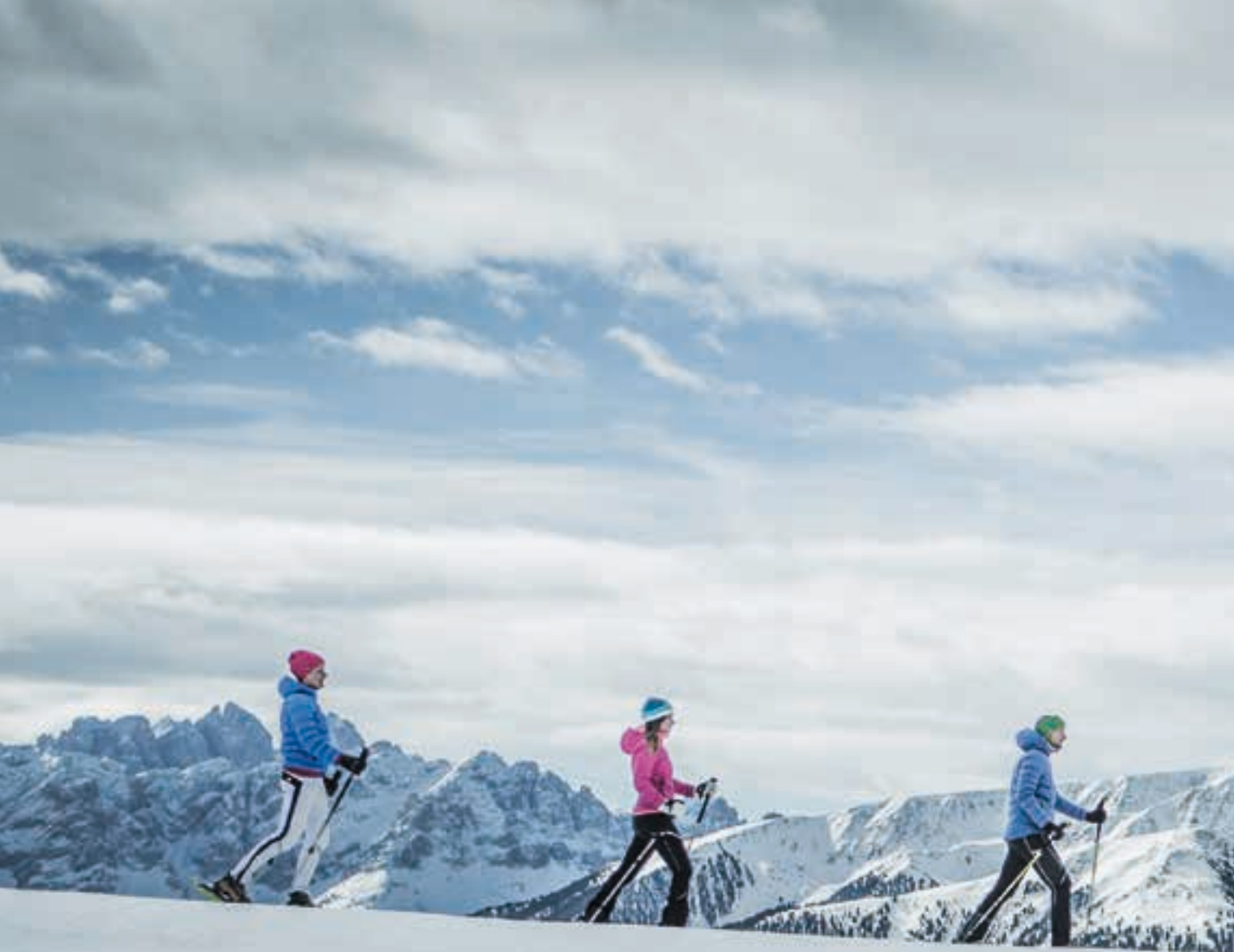
Alpe di Rodengo