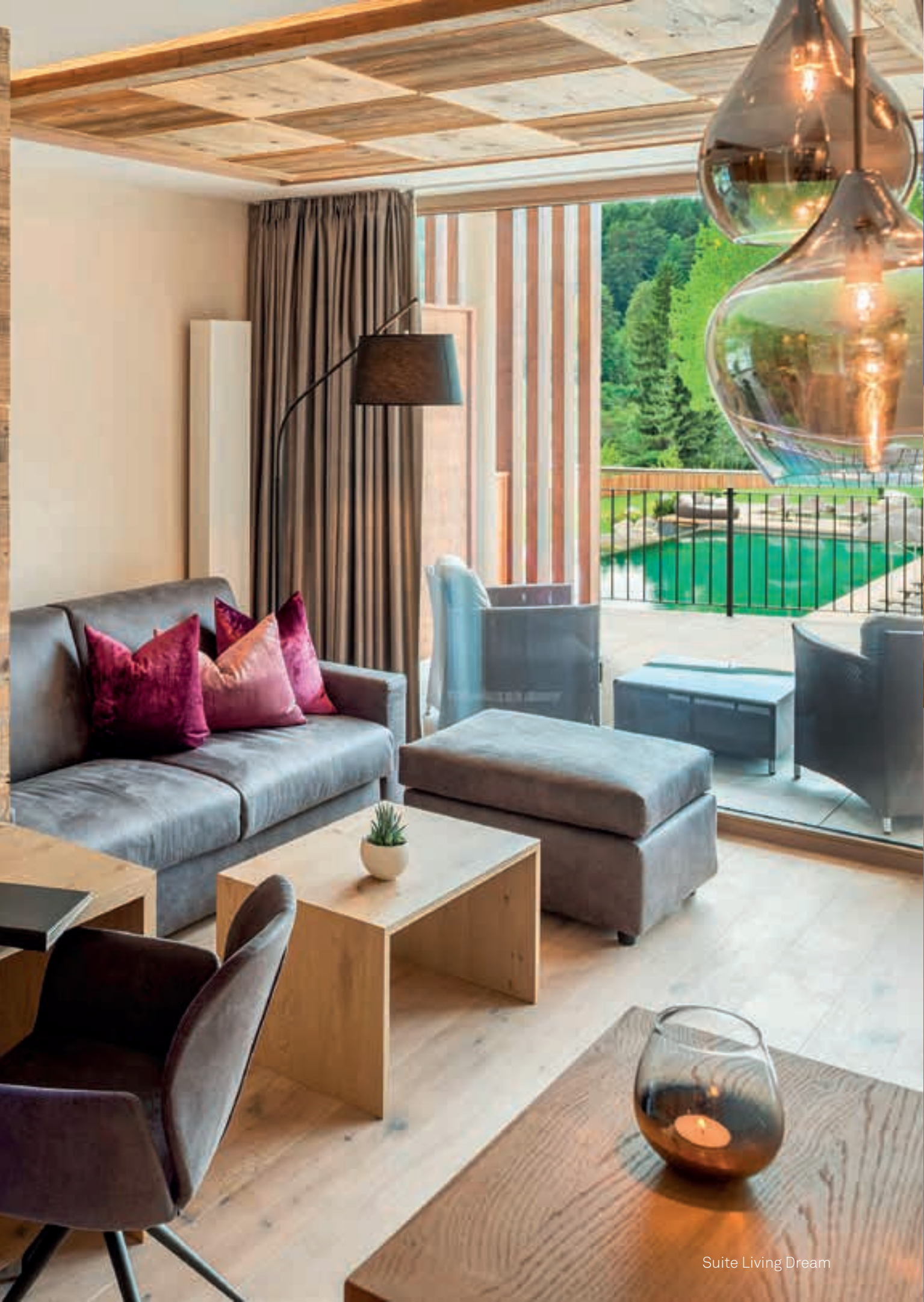
Suite Living Dream