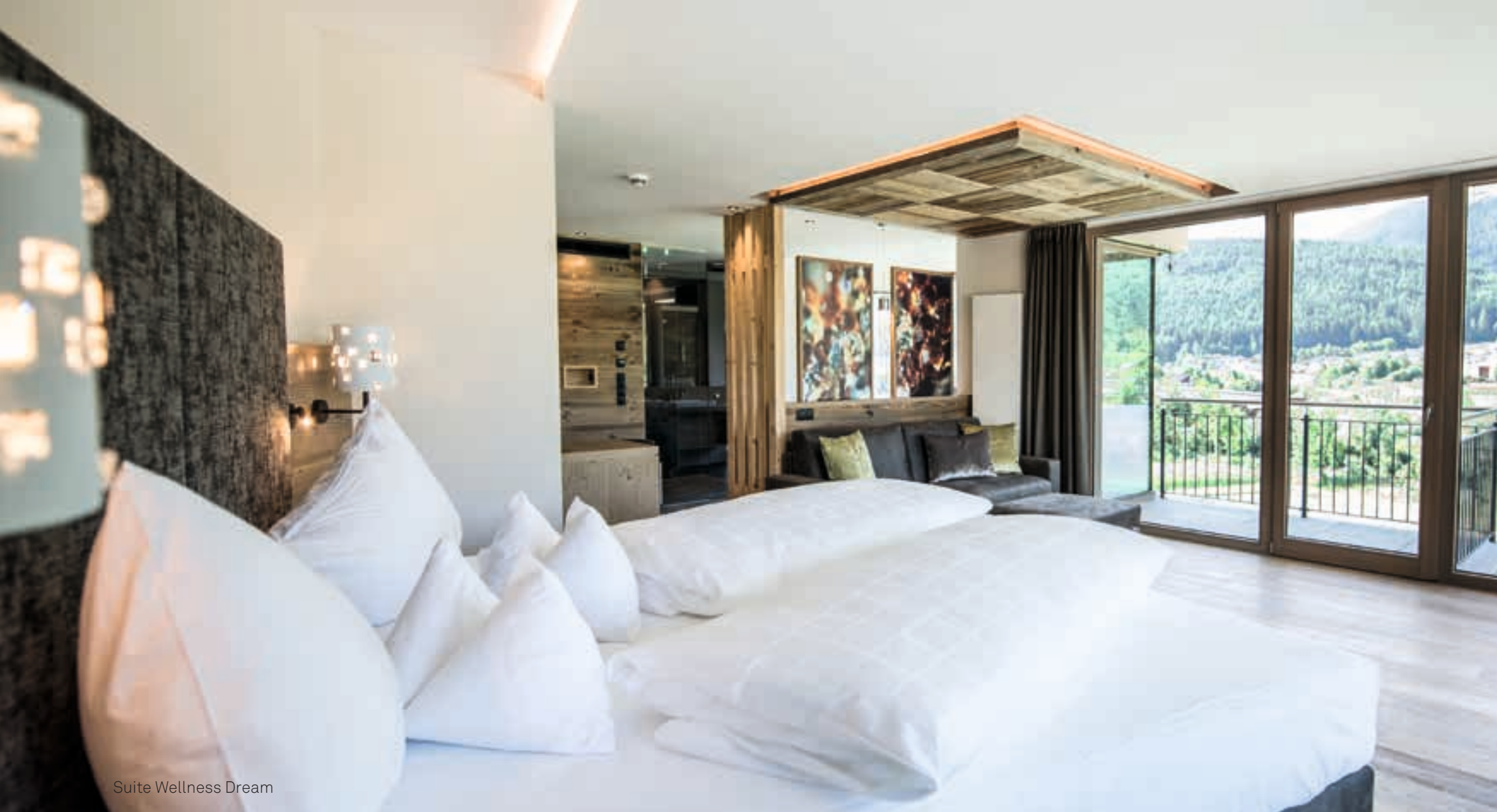
Suite Wellness Dream