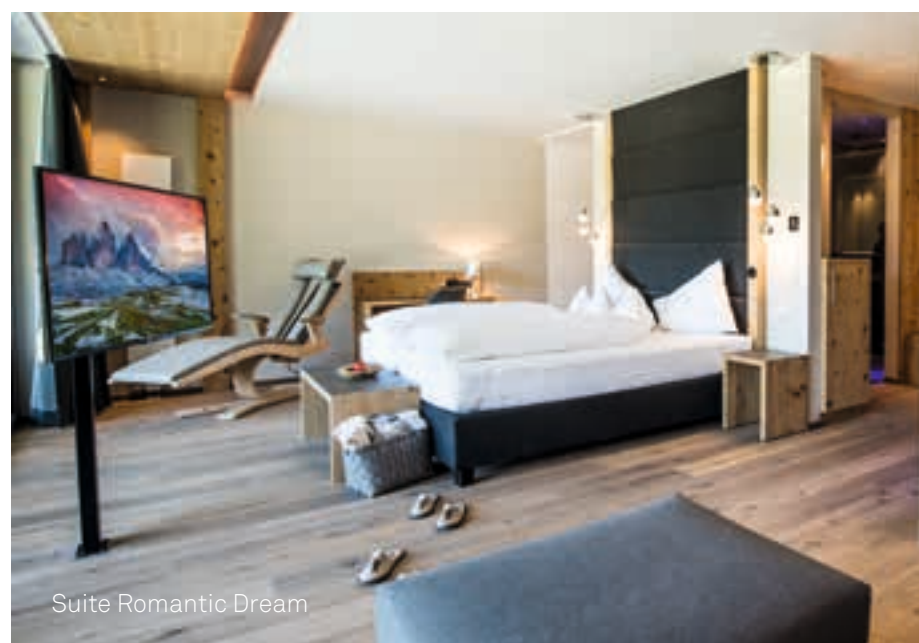
Suite Romantic Dream