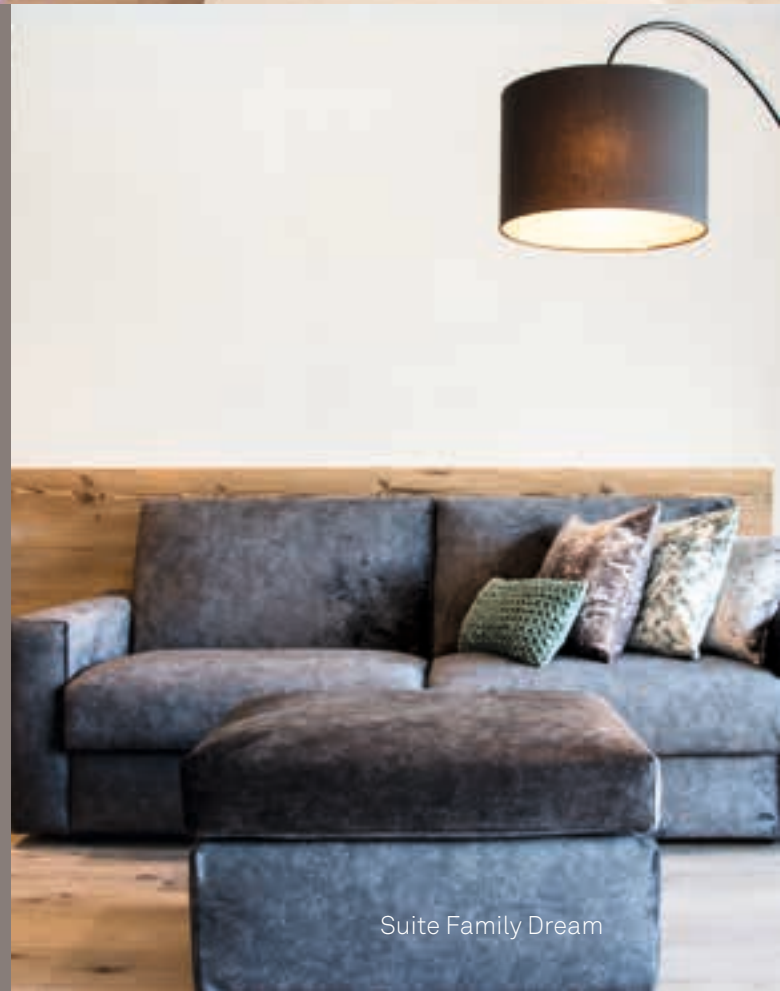
Suite Family Dream

Quiet hours and cosy moments await you in our light-flooded rooms and suites. Neat and fondly arranged, they offer a splendid view on our lovely garden. Close your eyes and enjoy peaceful moments!