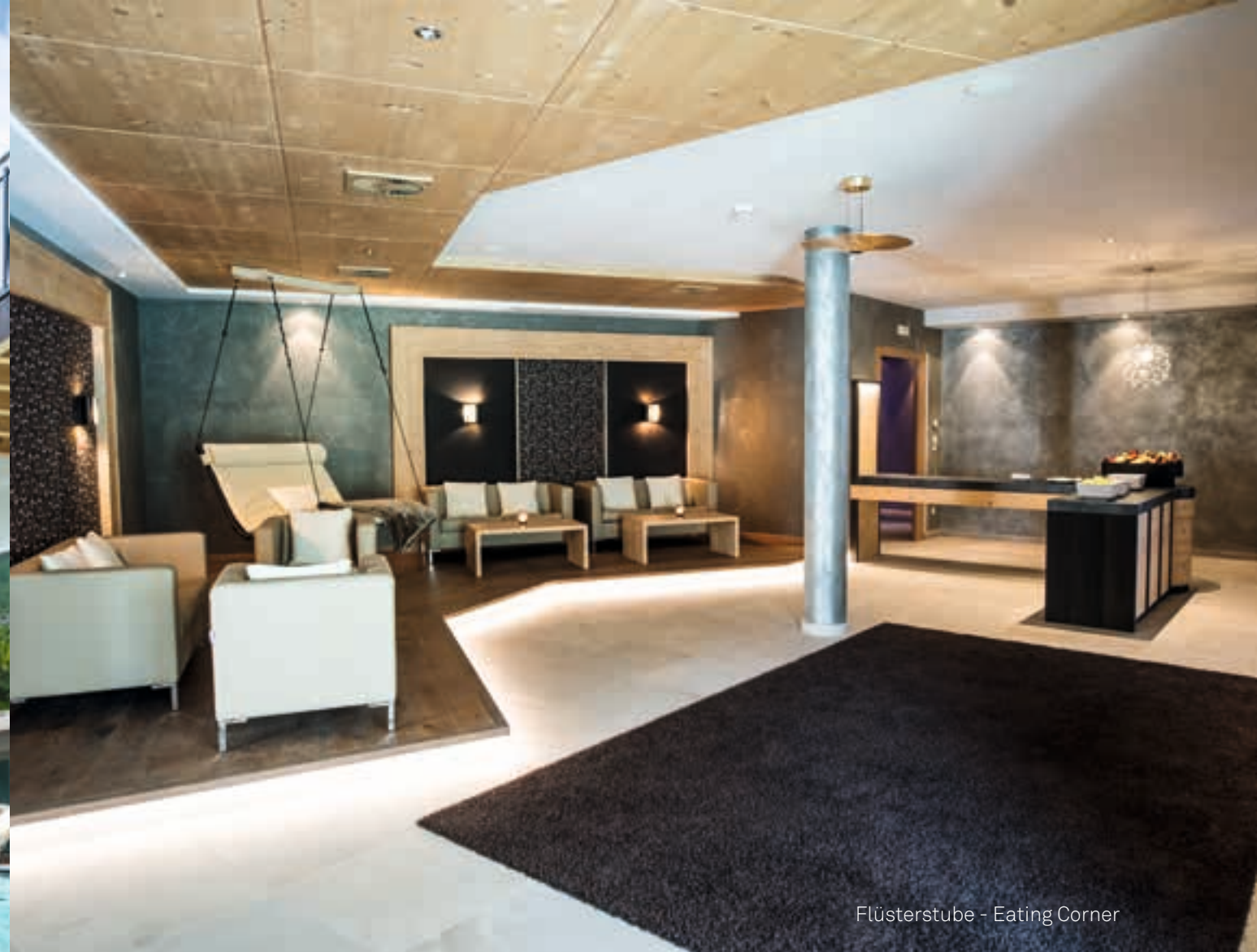
Flüsterstube - Eating Corner

Tanken Sie neue Energie und tun Sie sich etwas Gutes in unserem neuen Wasser-Wellnesbereich. Erfrischen Sie sich in unseren Pools und lassen Sie sich verwöhnen bei wohltuenden Massagen & Beauty-Anwendungen!