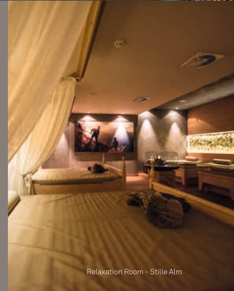
Relaxation Room - Stille Alm

Moments of pure relaxation await. Take a deep breath, let go and simply be. An oasis of peace and your personal safe haven awaits. Come in and let us spoil you!